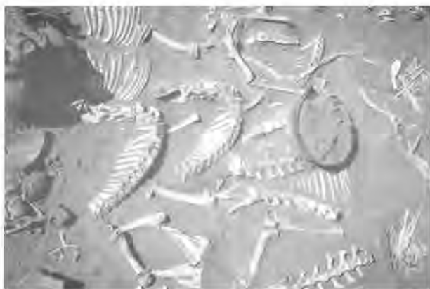
Fig. 2 : détail de quelques pièces de boucherie de la tombe 193 (Kerma moyen).

Ainsi dans la tombe 143, celle d'un adolescent de 10 à 14 ans, vingt quartiers de viande ont été déposés en plus d'un agneau entier. Dans la tombe 146, celle d'une jeune fille de 16 ans, on trouve dix pièces de boucherie alors qu'aucun capriné entier n'a été découvert.